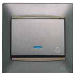
Pulsador timbre con señalizador luminoso