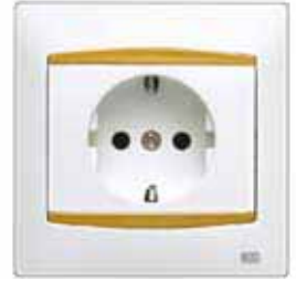
Base de enchufe