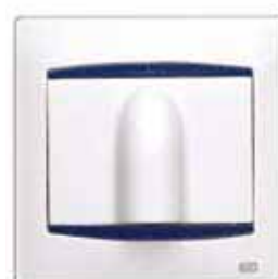
Salida de cable