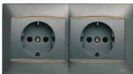
2 Bases de enchufe