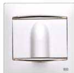
Salida de cable