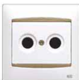
Entrada de antena