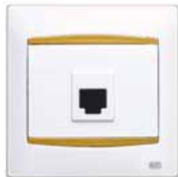
Toma de teléfono