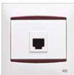
Toma de teléfono