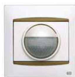
Detector de presencia