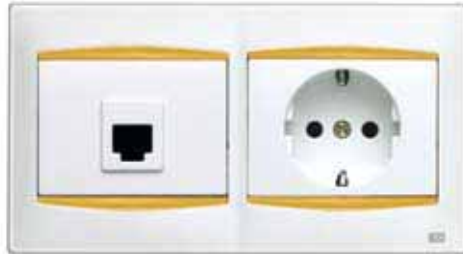
Toma de Teléfono + base de enchufe