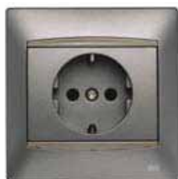
Base de enchufe