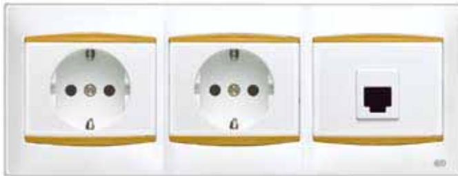
2 Bases de enchufe + Toma de teléfono