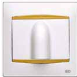
Salida de cable