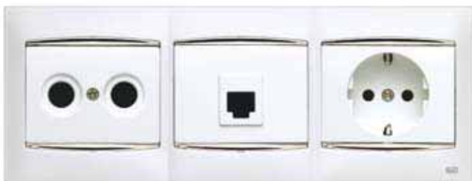
Entrada de antena + Toma de teléfono + Base de enchufe