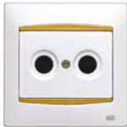
Entrada de antena