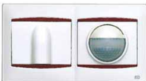
Interruptor de estado + detector de presencia