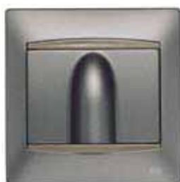
Salida de Cable