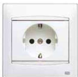
Base de enchufe