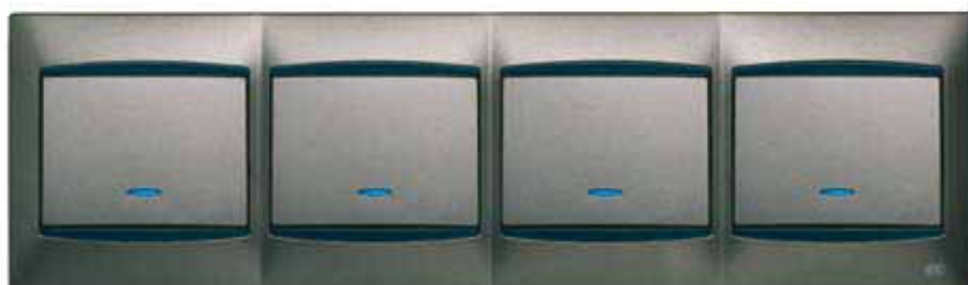
4 Bases de interrupción con señalizador luminoso