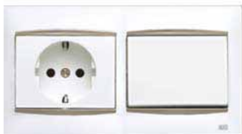
Base de enchufe + interrupción

La primera vivienda pide un equipamiento fácil, rápido, fresco. Pide Bjc Coral, una serie asequible con una amplia gama de posibilidades que permite disfrutar de todas las ventajas que ofrece la electricidad desde el primer día.