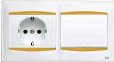
Base de enchufe + interrupción