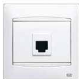
Entrada de teléfono