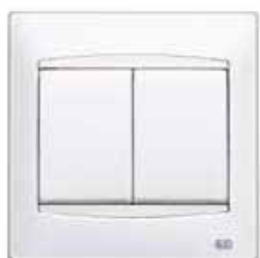
Doble tecla de Interrupción