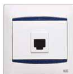
Toma RJ 45